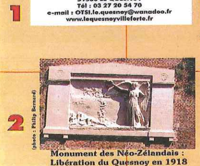
Monument des Néo-Zélandais : Libération du Quesnoy en 1918