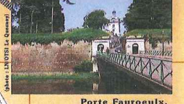
Porte Fauroux, porte typique des villes fortifiées du XIXè siècle