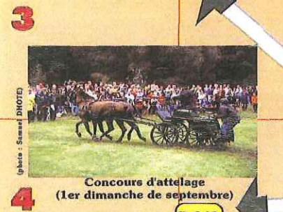
Concours d'attelage (1er dimanche de septembre)