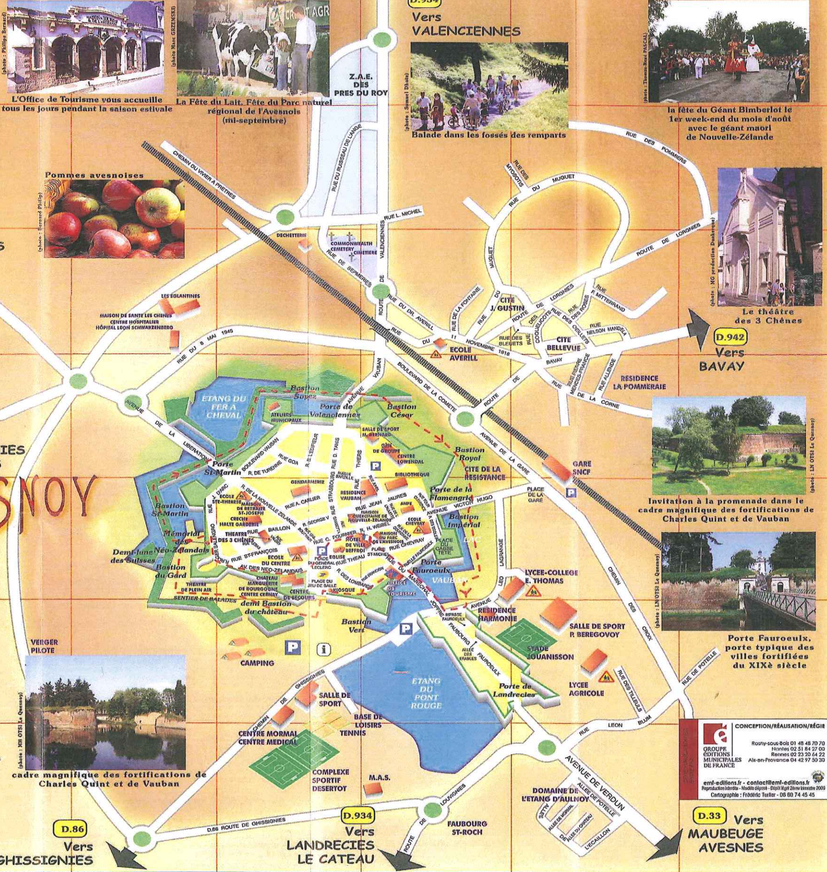
Invitation à la promenade dans le cadre magnifique des fortifications de Charles Quint et de Vauban