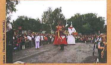
la fête du Géant Bimberlot le 1er week-end du mois d'août avec le géant maori de Nouvelle-Zélande