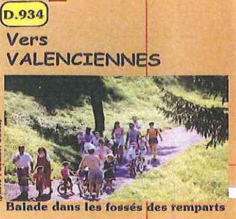
Balade dans les fossés des remparts