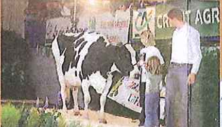
La Fête du Lait. Fête du Parc naturel régional de l'Avesnois (mi-septembre)