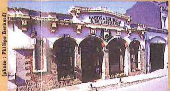
L'Office de Tourisme vous accueille tous les jours pendant la saison estivale

OFFICE DE TOURISME** 1, rue du Maréchal Joffre 59530 LE QUESNOY Tél : 03 27 20 54 70 e-mail : OTSI.le.quesnoy@wanadoo.fr www.lequesnoyvilleforte.fr