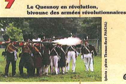
Le Quesnoy en révolution, bivouac des armées révolutionnaires